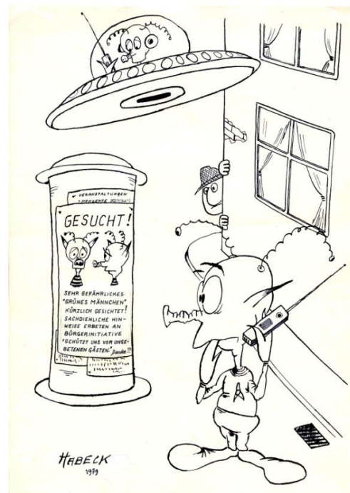
Erster Rüsselmops von 1979

Homepage von Robert Habeck : www.reinhardhabeck.at/