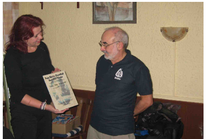
Ehrenmitglieder unter sich...