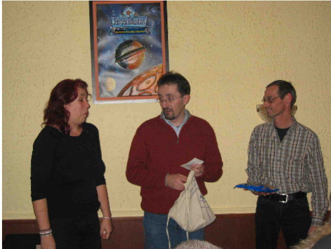
Die Siegerehrung nach dem Quiz