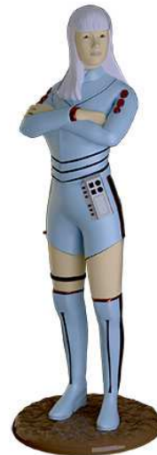
3-D-Modell (Eins A Medien)